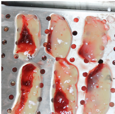
4 PRF (Platelet rich fibrin) hergestellt aus patienteneigenem Blut.